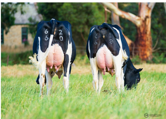
ROCKNROLL DAUGHTER GROUP L TO R - ROCKWELLA FARM ROCKNROLL DIXIE, ROCKWELLA FARM ROCKNROLL DEANNE